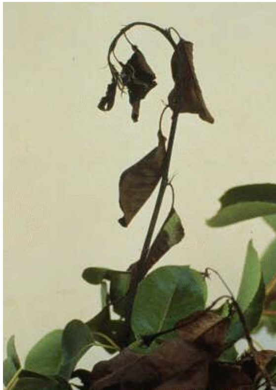
شکل ۷: عصایی شدن سرشاخه گلابی

با پیشرفت بیماری سرشاخه ها دچار بلایت می شوند که علائم بلایت سرشاخه و برگ ها در گلابی عمدتاً به رنگ قهوه ای تیره تا سیاه و در سیب به رنگ قهوه ای روشن تا تیره در می آیند. در صورتی که شرایط آب و هوایی مناسب برای توسعه بیماری باشد انتهای شاخه خم شده و شبیه به عصا به نظر می رسد که به این حالت سرعصایی شاخه می گویند (شکل ۷).