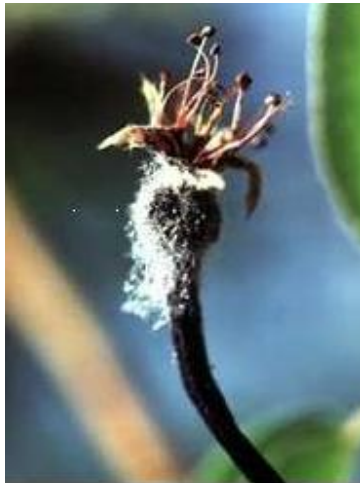
شکل ۴: سیاه شدن دمگل در اثر پیشرفت بیماری

پس از آلودگی شکوفه‌ها، میوه‌های جوان نیز با گسترش داخلی بیماری آلوده می‌شوند. علائم پیشرفته روی میوه‌های آلوده گلابی به رنگ سیاه ولی روی درختان سیب به رنگ قهوه‌ای است که به حالت مومیایی تا مدت‌های مدیدی روی درختان آلوده باقی می‌ماند (شکل ۵).