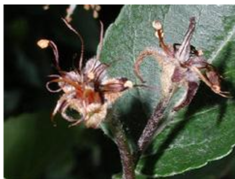
شکل ۳: در اوایل بهار لکه های آبسوخته روی گلبرگ ها تولید می شود و در فاصله کوتاهی مجموعه گل قهوه ای و سپس سیاه می شود.

حساس ترین اندام گیاهی درختان دانه دار نسبت به این بیماری گل ها هستند. این بیماری دارای ۵ فاز یا ۵ مرحله مهم آلودگی بنام های بلایت شکوفه، بلایت سرشاخه و برگ، بلایت میوه، بلایت شاخه های اصلی و تنه و بلایت ریشه (طوقه) می باشد. مهم ترین فاز بیماری بلایت شکوفه است، زیرا گل ها منافذ طبیعی ورود باکتری به اندام های گیاهی و توسعه بیماری می باشند. لذا معمولاً اولین علائمی که در فصل بهار ظاهر می گردد سوختگی شکوفه هاست. شکوفه ها ابتدا حالت آبسوخته پیدا می کنند و سپس پژمرده و چروکیده شده و به رنگ قهوه ای تا سیاه در می آیند. شکوفه های آلوده ممکن است که ریزش کنند ولی معمولاً متصل به شاخه های آلوده باقی می مانند (شکل ۳).