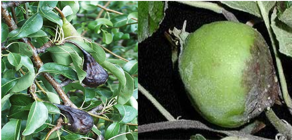
شکل ۵: آلودگی میوه سیب (سمت راست) و گلابی (سمت چپ) به باکتری عامل بیماری آتشک

پس از آلودگی شکوفه‌ها، میوه‌های جوان نیز با گسترش داخلی بیماری آلوده می‌شوند. علائم پیشرفته روی میوه‌های آلوده گلابی به رنگ سیاه ولی روی درختان سیب به رنگ قهوه‌ای است که به حالت مومیایی تا مدت‌های مدیدی روی درختان آلوده باقی می‌ماند (شکل ۵).