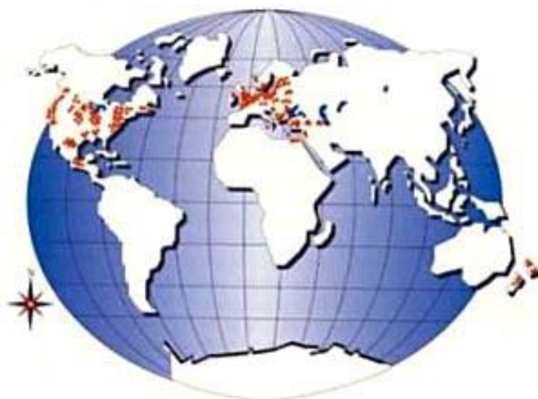
شکل ۱: انتشار بیماری آتشک درختان میوه دانه دار در دنیا

سابقه شناخت بیماری به بیش از ۲۰۰ سال می رسد. اما در سال ۱۸۸۴ جوزف سی. آرتور از دانشگاه کورنل با انجام آزمایشات تلقیح مجدد، باکتری بودن عامل بیماری آتشک را که اکنون Erwinia amylovora نامیده می شود، رسماً ثابت نمود. امروزه بیماری آتشک در ۴۶ کشور دنیا گسترش یافته است. در سرتاسر آمریکای شمالی شامل کانادا و مکزیک، انگلستان، هلند، کشورهای شمال غربی اروپا، قبرس، اسرائیل، ترکیه، یونان، بلغارستان، رومانی و تمام کشورهای استقلال یافته یوگسلاوی سابق و ایران این بیماری وجود دارد (شکل ۱).