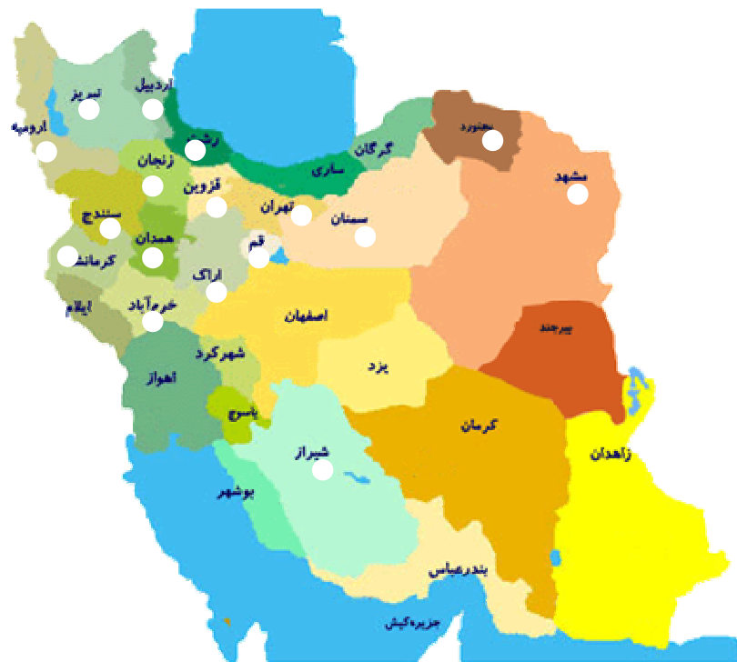
شکل ۲: انتشار بیماری آتشک درختان میوه دانه دار در ایران

مشاهده گردید و پس از آن به تدریج باغات مناطق مختلف و از همه مهم تر، برخی نهالستان های مهم کشور در استان تهران آلوده شدند. در حال حاضر این بیماری در استان های آذربایجان شرقی، آذربایجان غربی، اردبیل، تهران، خراسان شمالی، خراسان رضوی، زنجان، سمنان، قزوین، قم، کردستان، لرستان، مرکزی، گیلان، کرمانشاه و همدان نیز مشاهده شده و وجود آن به اثبات رسیده است (شکل ۲).