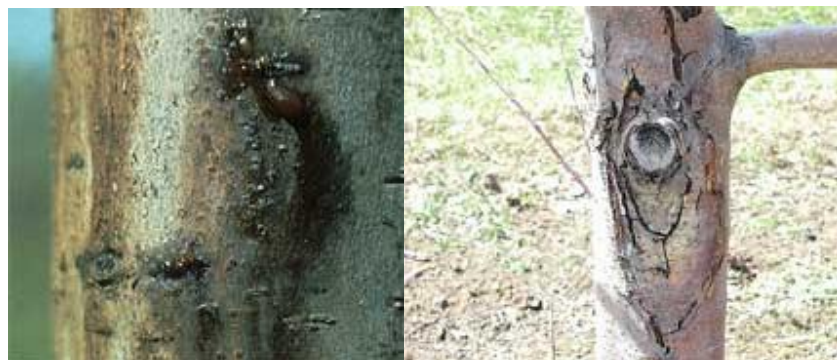
شکل ۸: تراوشات باکتری عامل آتشک بر روی پوست درخت

در بیشتر میزبان‌های حساس‌تر، آلودگی از طریق شکوفه‌ها، شاخه‌ها و حتی میوه به سمت پایین و تنه اصلی درخت گسترش می‌یابد. احتمال پیشرفت آلودگی به پایه و طوقه نیز وجود دارد. در این حالت اغلب همراه با پیشرفت بیماری مقدار زیادی تراوشات باکتریایی نیز روی پوست درخت جاری می‌شود. البته سوختگی پایه و طوقه مخرب‌ترین اثر را بر درخت داشته و اغلب باعث مرگ درختان می‌شود (شکل ۸).