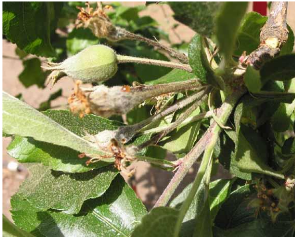
شکل ۶: ترشحات باکتری عامل آتشک روی دمگل

با پیشرفت بیماری سرشاخه ها دچار بلایت می شوند که علائم بلایت سرشاخه و برگ ها در گلابی عمدتاً به رنگ قهوه ای تیره تا سیاه و در سیب به رنگ قهوه ای روشن تا تیره در می آیند. در صورتی که شرایط آب و هوایی مناسب برای توسعه بیماری باشد انتهای شاخه خم شده و شبیه به عصا به نظر می رسد که به این حالت سرعصایی شاخه می گویند (شکل ۷).